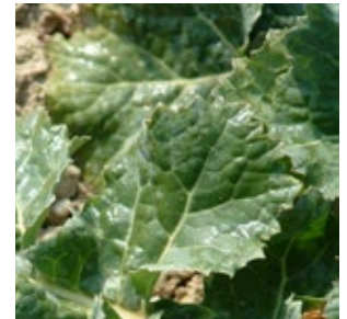
Insektizidspritzung im Raps mit Break-Thru