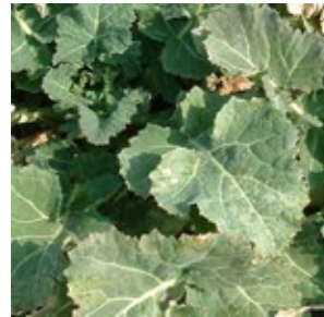
Insektizidspritzung im Raps ohne Netzmittel